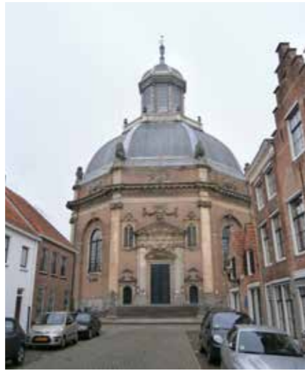
De 17de eeuwse Oostkerk in Middelburg met achtvormig grondplan