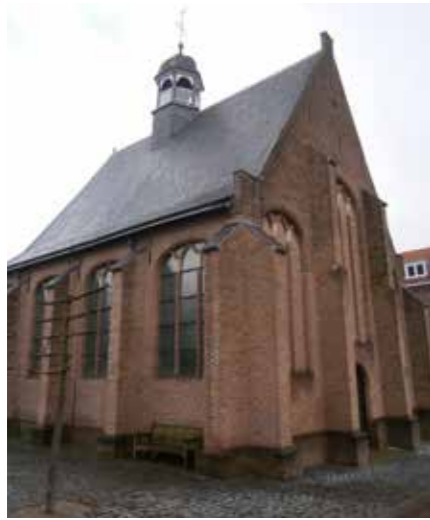
Garnizoenskerk in Ravenstein – kerk in gotische stijl in 1641 gebouwd voor het Staatse garnizoen in de vesting Ravenstein