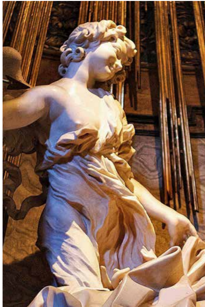
Extase van Theresia, Rome

De basiliek Santa Maria Della Vittoria in Rome, ontworpen door Carlo Maderno (1556-1926), ligt op de hoek van de Piazza di San Bernardo. De basiliek is niet prominent aanwezig. De gevel is niet gericht op het plein en de naastgelegen fontein trekt alle aandacht. Toch bezoeken veel toeristen deze kerk om het beeld de Extase van Theresia te bewonderen, een meesterwerk van Gian Lorenzo Bernini (1598-1680). Argeloze bezoekers zouden verrast kunnen worden door de overweldigende decoraties en de rijkdom van deze kleine barokke basiliek. Het enkelvoudige brede schip en de drie met elkaar verbonden zijkapellen staan vol met sculpturen en zijn voorzien van schilderijen en andere ornamenten van marmer en goud. Alle delen vloeien in elkaar over en het is moeilijk om onderscheid te maken tussen structuur en ornamentiek, tussen beeldhouwkunst en schilderkunst. Daarnaast zijn er bij de heilige beelden christelijke symbolen te ontdekken die naar de afgebeelde heilige verwijzen. Ook het Latijnse kruis, symbool voor het christendom, is meerdere malen aanwezig.