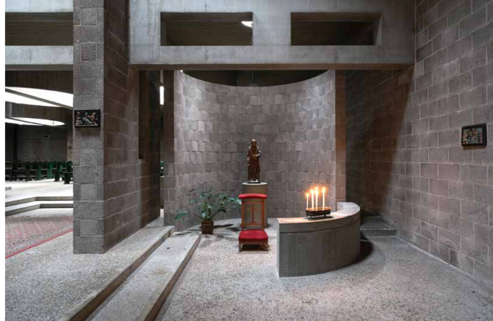
Pastoor van Arskerk, Den Haag ▲▼

zijn symmetrisch geplaatst in de hoeken van de muren van de binnenplaats. Deze deuren vormen de verbindende elementen tussen de binnenplaats en de ruimte om te bidden. Na binnenkomst leidt een symmetrisch geplaatste dubbele galerij naar een zaal die lichter en hoger is dan de galerijen. Het licht komt binnen via verticale ramen bovenin de muren. Op een zonnige dag worden in de ochtend de lichtstralen naar de ingangen geleid, terwijl in de middag het licht vanuit de ingang richting het altaar binnenstroomt. Een lichte of een bewolkte dag is van invloed op de lichtinval in deze ruimte. De ramen, die dus afhankelijk van de tijd en de zon een verschillende lichtintensiteit binnenlaten, staan in lijn met de zuilen van de galerij. Van der Laan ontwikkelde een eigen proportioneel systeem voor het ordenen van de ramen met de kolommen. Dit systeem is toegepast op de hele kerk, zo staat de breedte van de galerijen in een bepaalde verhouding tot de breedte van de totale ruimte in de verhouding twee staat tot zeven.