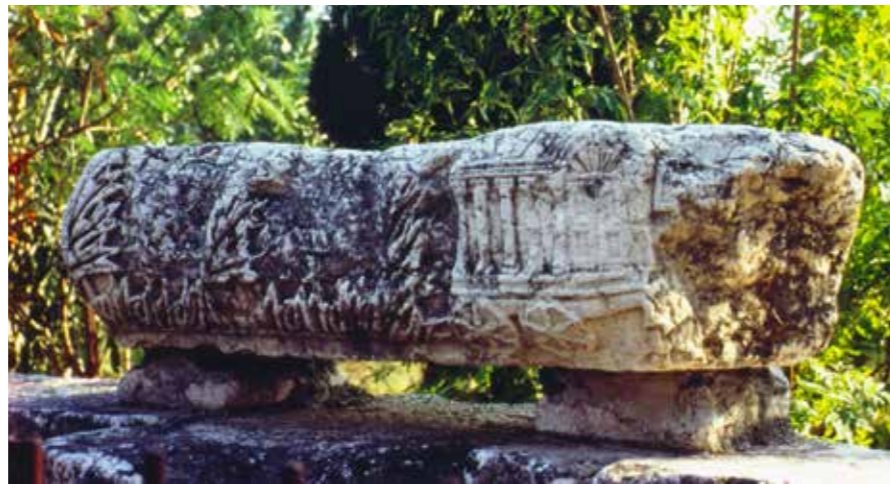
Kafarnaüm, mobiele bewaarplaats voor de Thorarollen

Voor de catholica is er maar één mogelijkheid: desacraliseren en dan liefst afbreken. Onttrekken aan de eredienst. Een kerkgebouw is heilig, het huis van God. 19 Kerkelijk spraakgebruik kent in heiligheid geen gradaties. Een ‘halve heilige’ hoort thuis in het wereldlijk jargon, niet in het kerkelijke. Men is heilig of men is het niet. Voor het protestantisme ligt dat iets eenvoudiger: de kerk is daar ook een gebouw, als massa, zonder een speciale heiliging, immers: ‘Men kan overal liturgie vieren’ (Abraham Kuijper). 20 Een stelling die trouwens zeker niet onaantastbaar is, maar in vele gereformeerde kerkgebouwen duidelijk heeft doorgewerkt. In de katholieke traditie speelt uiteraard ook het al eerder genoemde tabernakel mee, de plaats van de heilige reserve. Het kerkgebouw is het thuis voor deze geheiligde gaven.