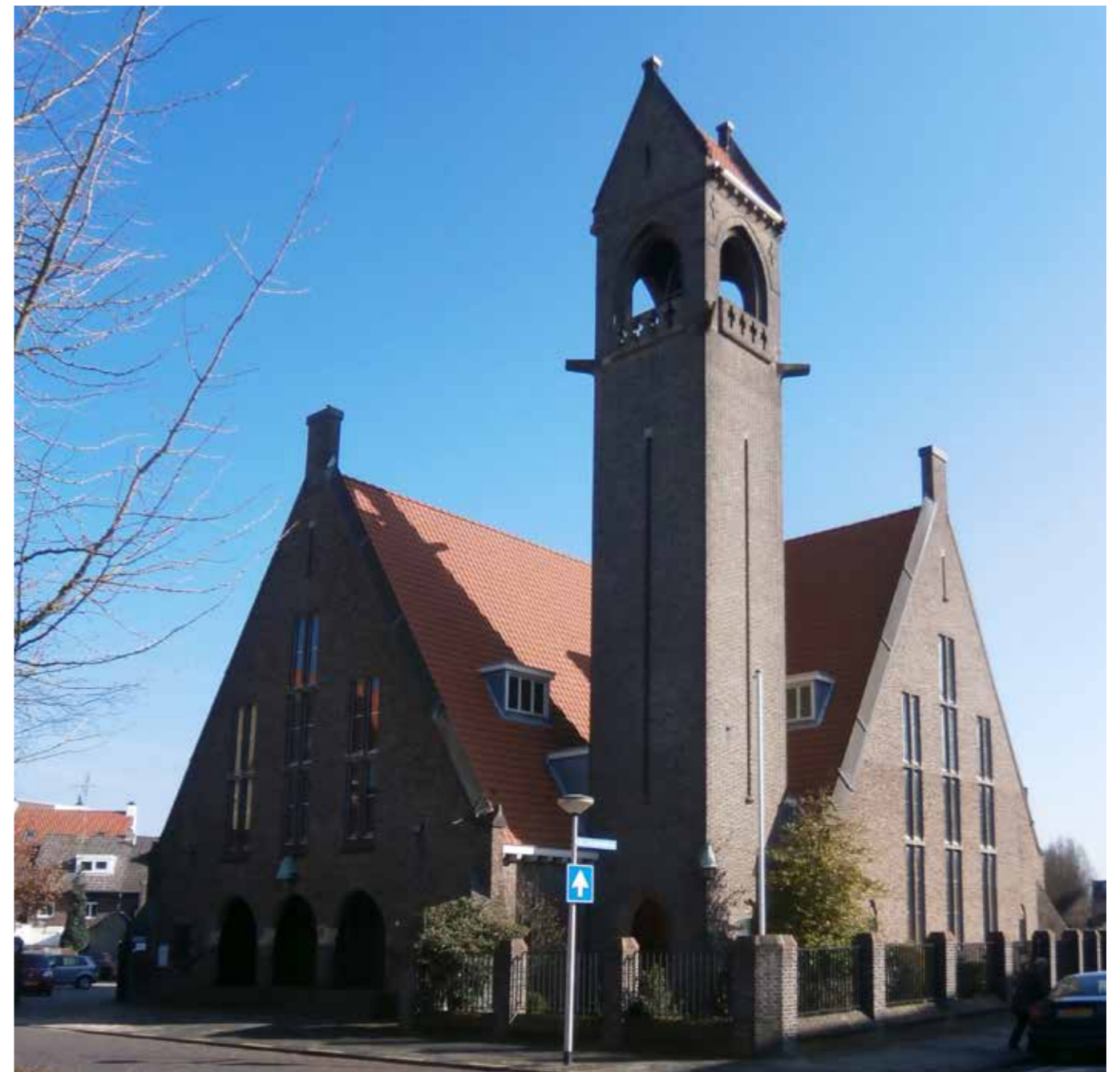
Templespleinkerk te Heerlen, 1931-32, traditionalisme vermengd met een moderner vormentaal

Wereldoorlog, de watersnoodramp 1953 en de inpoldering en daarmee de ontwikkeling van nieuwe steden.' 7 In 1962 trad de Wet Premie Kerkenbouw in werking. Negen kerkgenootschappen reageerden in 1964 in vereende kracht met de actie Antwoord '64 om geld in te zamelen voor kerkbouw in de zich uitbreidende stad: of ieder kerklid een honderdste van zijn jaarinkomen wilde