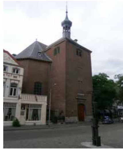
Waalse Kerk te Maastricht in een sobere barokke stijl, omstreeks 1730

doneren. Motto: ‘In de groeiende nieuwe steden, die zelf groeiende nieuwe vragen zijn, daar zullen kerken staan, en u zult ze bouwen.’ Symbool van deze actie werd de Antwoorderk in Hoogvliet, die het uithield tot 2018. De kerk werd dus geen monument, het mysterie werd door de nieuwbouwwijk niet blijvend opgepakt. (zie kader)