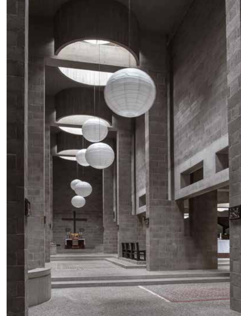
Pastoor van Arskerk, Den Haag