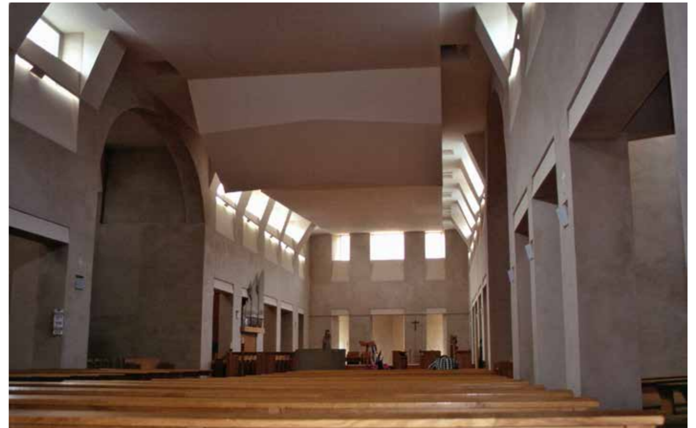
Cîteaux, Abdijkerk met altaar