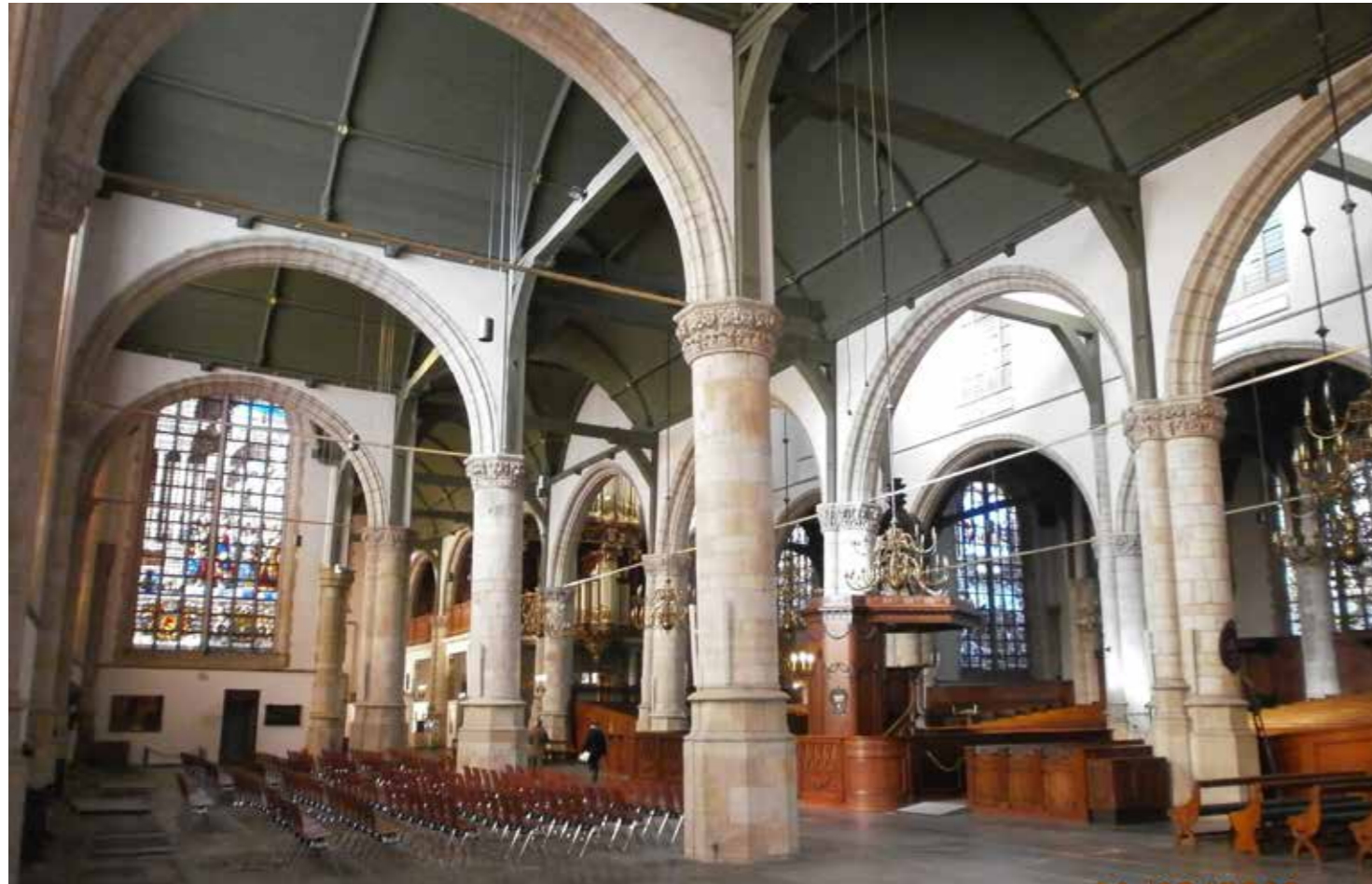
Sint-Janskerk, Gouda: de ruimtelijkheid van het interieur als kenmerk van een kerkgebouw