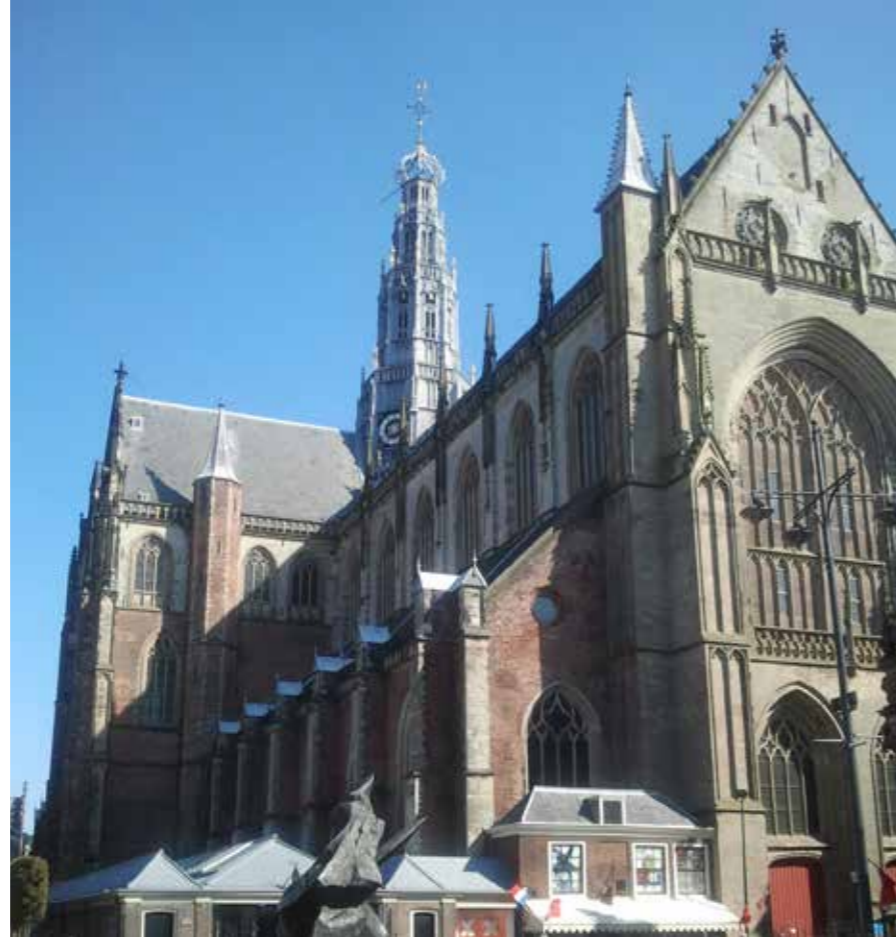
Grote of Sint-Bavokerk in Haarlem, een middeleeuwse stadskerk