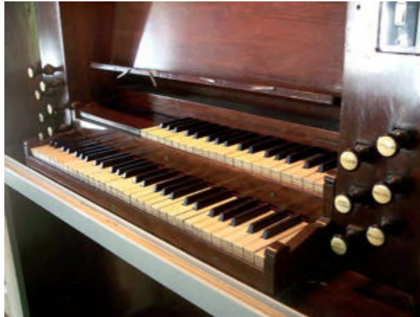
Orgel kerk van Haringhuizen, klaviatuur

Windlade – doos waarop de pijpen opgesteld staan