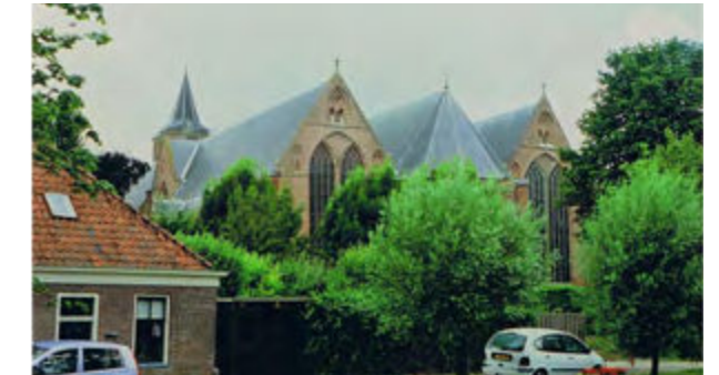
Grote Kerk van Edam

Kleinere steden hadden meestal hallenkerken (Amsterdam, Amersfoort, Weesp en Naarden). Dit zijn meerschepige kerken, waarvan de zijschepen even hoog zijn als het middenschip, dus kerkgebouwen van twee of meer beuken van ongeveer gelijke hoogte en meestal ook ongeveer gelijke breedte.