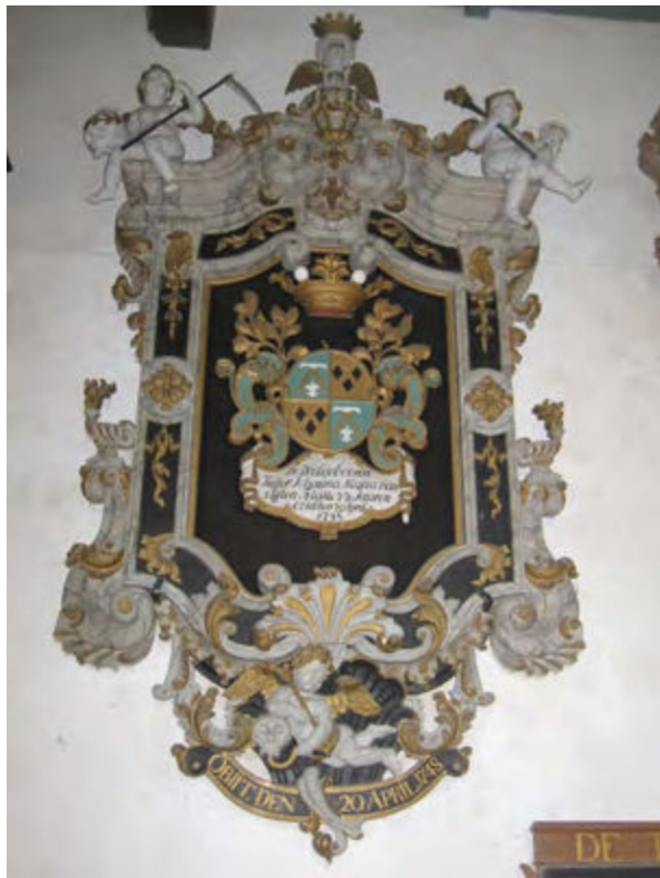
Rouwbord, kerk van Hegebeitem