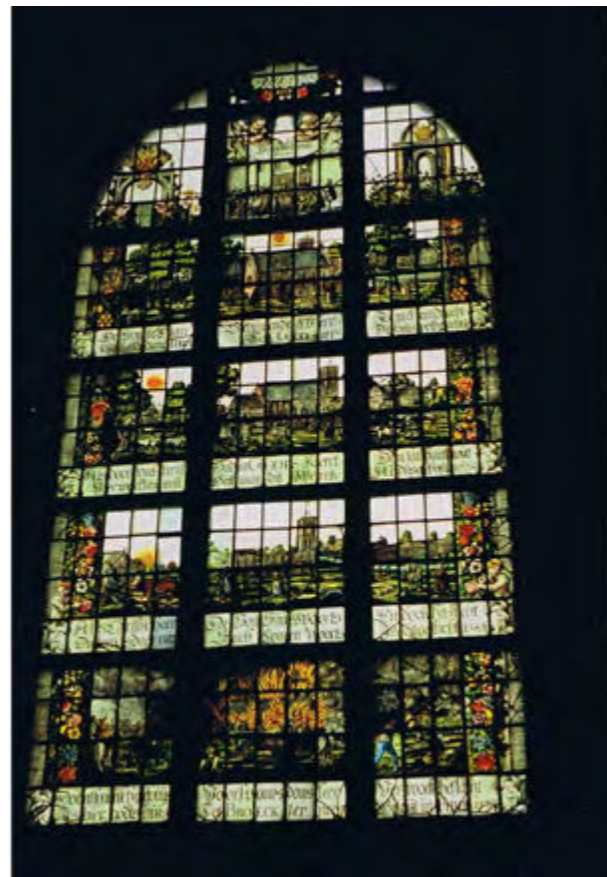
Gebrandschilderd glas met de geschiedenis van het kerkgebouw, Broekerkerk, Broek in Waterland