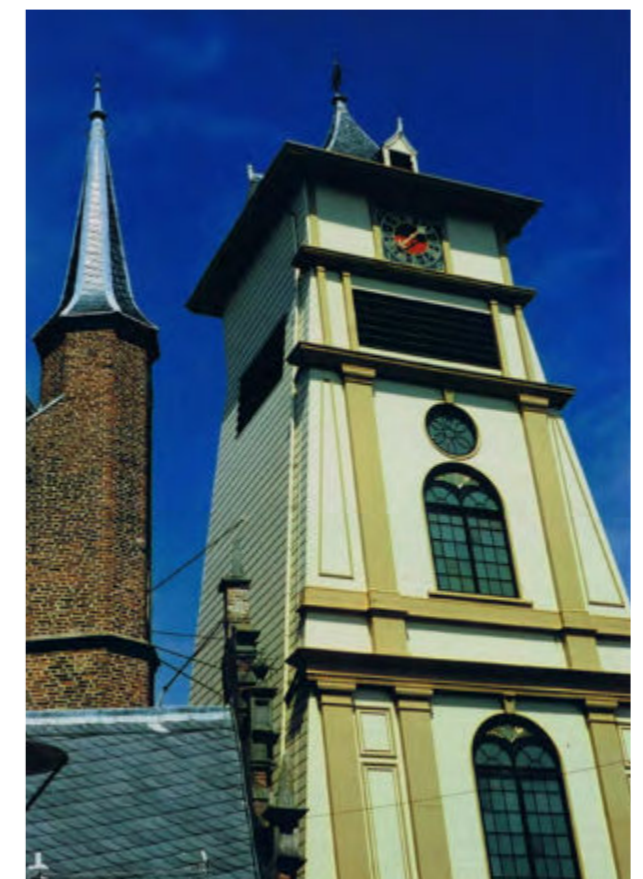
Houten toren naast de Westerkerk, Enkhuizen