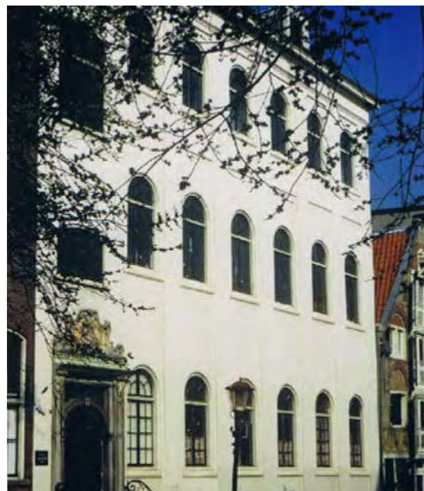
Armeense kerk, Amsterdam

Enkele parochies kunnen samen een dekenaat vormen, onder leiding van een deken .