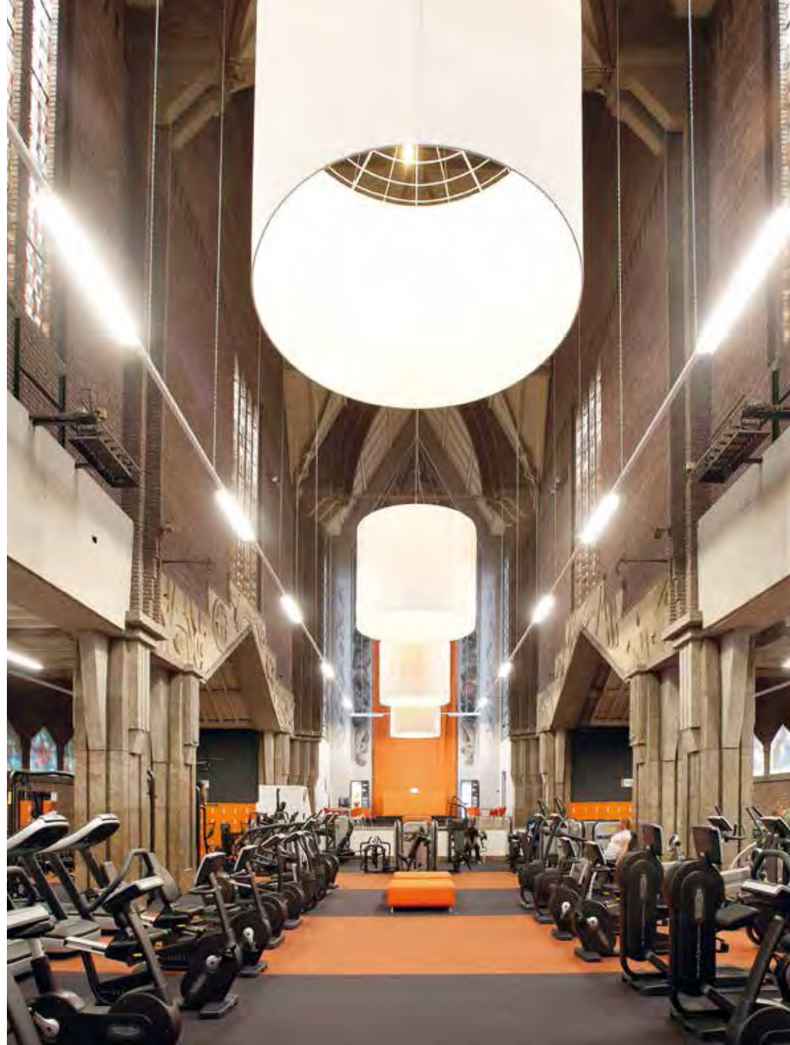
Sportschool in de voormalige Hubertuskerk in Maastricht