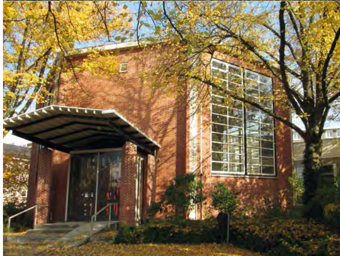
De Weerenkapel (boven) en de Maranathakerk