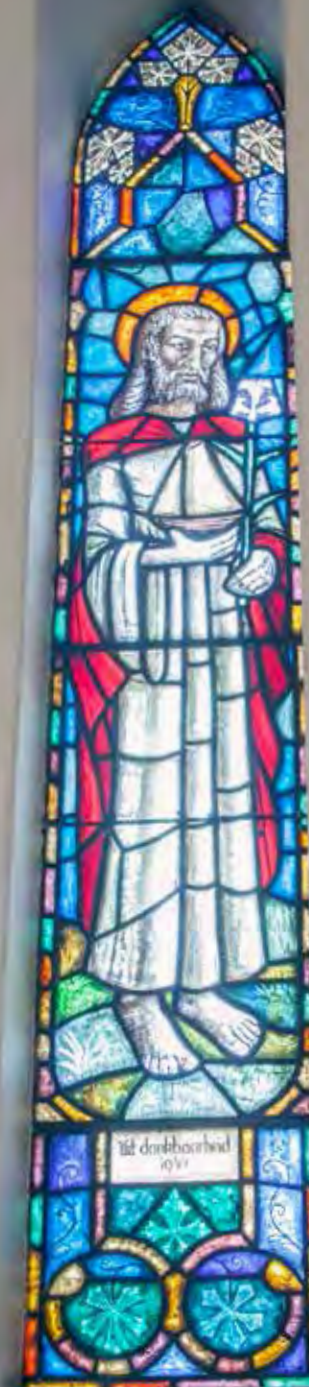
Glasraam in de kapel van het Nemiusklooster in 's-Hertogenbosch